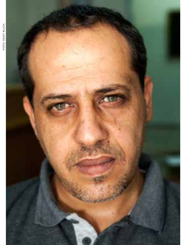
Al Mezan kritiserar alla brott mot mänskliga rättigheter, oavsett om de begås av Hamas, Fatah eller Israel.

Kriget i somras var en svår tid för Al Mezans medarbetare. Fältarbetarna tog stora risker när de samlade in material om det som skedde under Israels attacker. Både de i fält och medarbetarna på kontoret påverkades personligen på olika sätt. De landområden som ligger närmast den kilometerbredda buffertzonen mot Israel drabbades mycket hårt av Israels bombningar i juli och augusti.