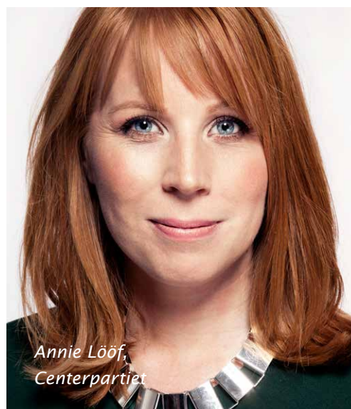
Annie Lööf, Centerpartiet